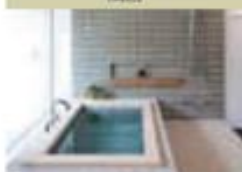
デザイン浴槽 ERN Series COOL JAPAN AWARD 2015 受賞作品 表彰対象 | デザイン浴槽(ERN Series) 表彰対象者 | 株式会社アステック 地区 | 神奈川県横浜市