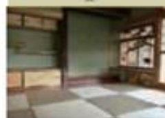
セキスイ畳「MIGUSA」 COOL JAPAN AWARD 2017 受賞作品 表彰対象 | セキスイ畳「MIGUSA」 表彰対象者 | 株式会社成興工業 地区 | 大阪府大阪市