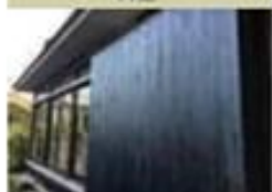
藍染杉 COOL JAPAN AWARD 2017 受賞作品 表彰対象 | 藍染杉 表彰対象者 | 大村木材株式会社 地区 | 鹿児島県鹿児島市