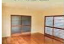
西川材のクロス 食堂と寝室には、「西川材ひとつぼ茶室」でも使用されている西川材のクロスが使われています。