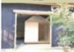
西川材とひとつぼ茶室 COOL JAPAN AWARD 2017 受賞作品 表彰対象 | 西川材とひとつぼ茶室 表彰対象者 | 西川材とひとつぼ茶室 地区 | 埼玉県熊谷市